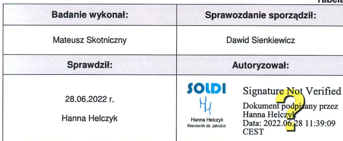
Tabela nr 6

Stwierdzenia zgodności dokonano na podstawie zasady podejmowania decyzji i wymagań zawartych w załączniku do Rozporządzenia Ministra Klimatu z dnia 17 lutego 2020 r. w sprawie sposobów sprawdzania dotrzymania dopuszczalnych poziomów pól elektromagnetycznych w środowisku [Dz. U. 2020, poz. 258, Dz. U. 2022, poz. 1121].