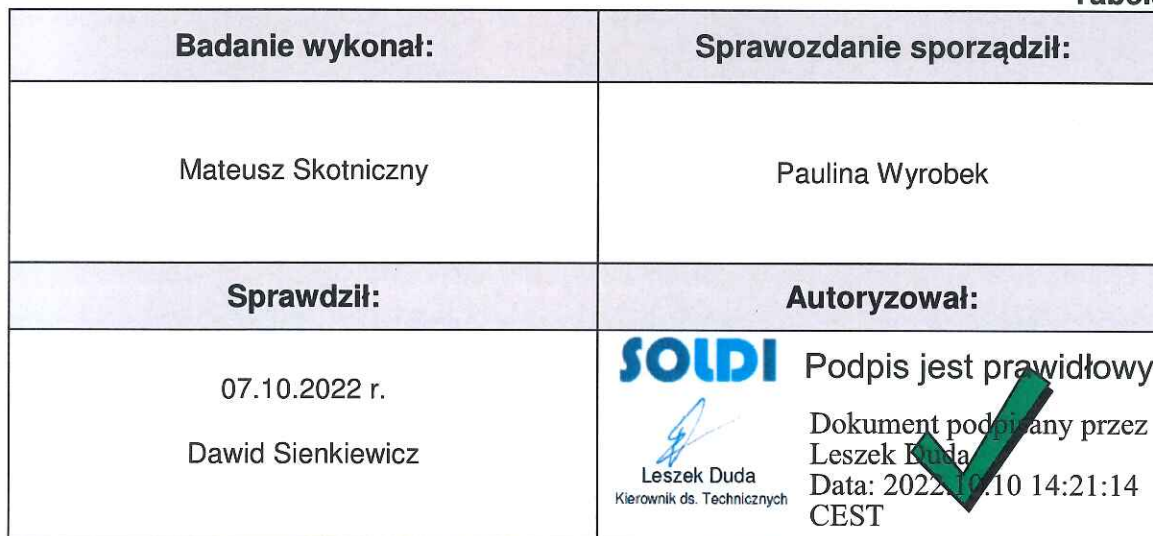
Tabela nr 6

Stwierdzenia zgodności dokonano na podstawie zasady podejmowania decyzji i wymagań zawartych w załączniku do Rozporządzenia Ministra Klimatu z dnia 17 lutego 2020 r. w sprawie sposobów sprawdzania dotrzymania dopuszczalnych poziomów pól elektromagnetycznych w środowisku [Dz. U. 2020, poz. 258, Dz. U. 2022, poz. 1121].